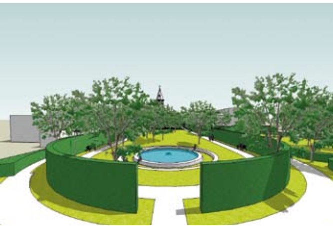
Animatiebeelden ontwerp Andy Malengier